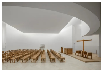
Le panneau carré surplombe la partie centrale de l'église. Il diffuse la lumière zénithale de la verrière située au-dessus.

À l'opposé, en façade ouest, s'avancent deux volumes rectangulaires de part et d'autre de l'entrée. L'angle sud s'interrompt au-dessus du sol, incisé d'une entaille triangulaire qui exprime une volée de l'escalier qu'il contient. Des couvertines en marbre marquent discrètement le haut des murs intermédiaires et des terrasses, du zinc étant réservé à la toiture.