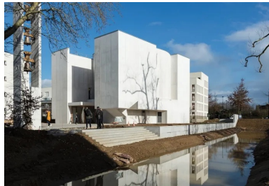
Le demi-cylindre de l'abside émerge en porte-à-faux de la façade est.

D'apparence simple, le schéma structurel est en réalité complexe. Le renvoi des forces structurelles très important disparaît dans la masse, introduisant une ambiguïté avec ce qui est visible.