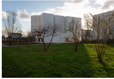
La hauteur de l'église s'accorde à celle des bâtiments alentour.

Accessible par un escalier fermé, dans la continuité de la circulation verticale secondaire qui comprend l'ascenseur, la petite sacristie occupe le dernier étage.