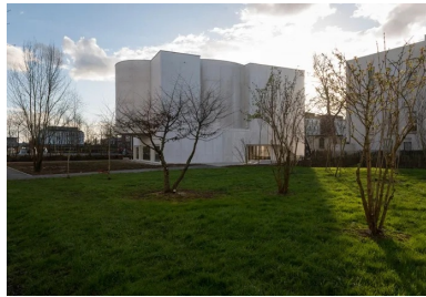
La hauteur de l'église s'accorde à celle des bâtiments alentour.

Accessible par un escalier fermé, dans la continuité de la circulation verticale secondaire qui comprend l'ascenseur, la petite sacristie occupe le dernier étage.