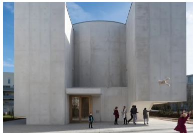
Façade ouest d'entrée : l'espace public et le parvis de l'église se confondent.

À deux pas de la mairie et jouxtant les vestiges d'une chapelle du xviii e siècle, le site retenu est une petite parcelle contrainte de 400 m 2 . Il est compris entre un bassin d'eau qui le sépare de la rue du Haut-Bois, une voie départementale et des cheminements piétons. Autour, des immeubles de logement de cinq étages, des espaces verts et, un peu plus loin, des équipements caractérisent ce nouveau quartier devenu le cœur de Saint-Jacques-de-la-Lande.