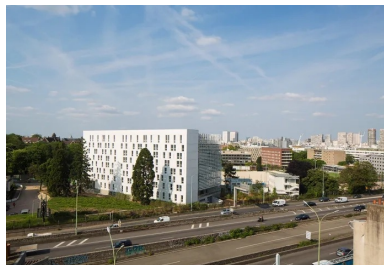
Les façades sud et ouest en lien direct avec les flux de voitures circulant sur le boulevard périphérique.

Les étudiants logés dans cette Maison de la Corée vont profiter d'un lieu de vie confortable, lumineux et serein.