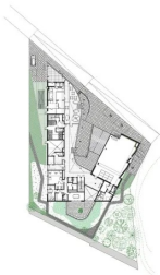
Plan de rez-de-chaussée haut 1. Épicerie 2. Restaurant coréen 3. Salle polyvalente 4. Accueil 5. Pôle d'administration 6. Patio coréen rez-de-chaussée bas

Le volume construit, s'il déploie une géométrie aux lignes simples, fait preuve d'une grande pertinence quant à son implantation, à sa composition et à l'orientation des éléments qui le constituent. Et plutôt que de parler de faces pour l'ensemble de ce bâtiment au volume atypique, il serait plus juste de parler d'un développé de façade qui se déroule et dont la nature se modifie en fonction de son environnement , plus ou moins ouvert ou protégé selon les besoins et les nuisances. Par cette volumétrie, la Maison de la Corée tend ses bras vers le parc tout en donnant un sentiment de bienvenue au passant.