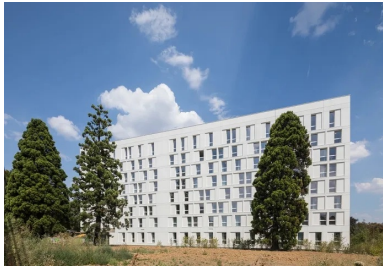
La façade ouest, plus fermée car exposée aux nuisances et composée de panneaux de béton blanc dépolluant.

La Cité internationale universitaire de Paris (CIUP) peut être qualifiée de lieu d'exception par son échelle, par la diversité de ses architectures et par la surface de son parc. Aussi, chaque nouvelle construction relève de l'événement, notamment parce que la dernière en date remonte à 1969. La Maison de la Corée, qui ouvre ses portes cet automne, amorce la densification souhaitée de la Cité, avec 10 nouvelles maisons programmées, soit environ 1 800 logements venant s'ajouter aux 6 000 déjà existants. Pour atteindre cet objectif, les parcelles dédiées aux nouvelles constructions se situent pour la plupart à la lisière du boulevard périphérique, la zone la moins dense de cet ensemble immobilier – un contexte à fortes nuisances, bruit et pollution, qui impliquait une réponse adaptée. Tel fut le cas pour la Maison de la Corée. La proximité de cette 4 voies est devenue un des points forts du projet lauréat, déclinant la créativité des architectes.