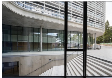
L'accès au rez-de-chaussée bas, semi-enterré, se fait par un large escalier en béton.

un béton isolant structurel, utilisé pour réaliser les dalles des balcons, a permis d'éviter la pose de rupteurs de pont thermique.