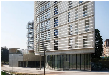
Une architecture faite de pleins et de vides, et de lignes, à la fois souples et épurées.

Précisément, le programme et la configuration de la parcelle ont amené les architectes à définir un projet à trois orientations majeures. Une partie des chambres, exposées nord-est, compose une façade de balcons, particulièrement vitrée, qui se déroule face au parc de la CIUP. La façade ouest, largement exposée aux nuisances du boulevard périphérique, accueille l'autre partie des chambres et logements. Cette façade, plus fermée, a été pensée comme un élément monolithique entièrement réalisé par l'empilement d'éléments en béton préfabriqué blanc. Côté sud, face au boulevard périphérique, la façade présente un linéaire réduit, dédié aux cuisines collectives d'étage et aux salles de restauration, protégées par une double peau composée de brise-soleil et de coursives d'entretien renforçant l'isolation thermique et acoustique d'un mur rideau performant.