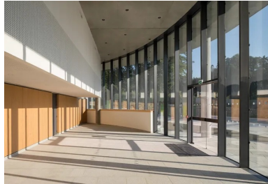
Le plafond du hall principal, façon faux plafond en béton gris autoplaçant, « suspendu » à la dalle porteuse des étages supérieurs.

Autre point remarquable, le plancher à double dalle correspondant au plafond du hall principal en double hauteur. Il permet de dévoyer les gaines et « d'absorber » la retombée de poutre de 1 m, laquelle supporte les étages supérieurs des chambres. Ce plancher se compose d'une dalle porteuse et d'une dalle en béton autoplaçant fonctionnant comme un faux plafond « suspendu » avec éclairage intégré, grâce aux réservations prévues au moment du coulage.