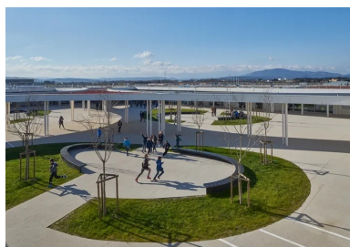
Le système en cour de cloître forme une protection contre les vents fréquents.

En pénétrant dans la cour, les quatre ailes s'offrent d'un seul regard, abritant à l'ouest, de chaque côté d'un couloir central ponctué d'un patio , les locaux administratifs et les locaux collectifs des élèves donnant sur la cour (CDI, foyer, sanitaires). Au nord, se trouve le pôle Segpa. Les deux autres ailes accueillent les salles d'art, de sciences et d'enseignement général au sud.