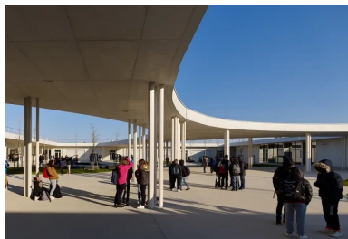
Le bâtiment est organisé autour d'un atrium central.

Le programme est très classique pour ce type d'établissement : les bureaux pour l'administration, les locaux pour les enseignants, les salles d'enseignement général, scientifique, artistique, technologique, ainsi qu'une section Segpa service à la personne, vente et cuisine. Il peut accueillir 600 élèves, mais a été conçu pour recevoir une extension (en partie est), sans dénaturer le fonctionnement de l'établissement.