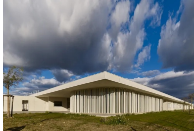
La salle polyvalente constitue un élément structurant fort de l'établissement.

« Lorsque nous avons visité les lieux la première fois, nous étions un peu désespérés car nous nous retrouvions sur une parcelle toute plate, au milieu des champs et en plein vent, avec tout autour une zone pavillonnaire en extension. Mais l'atout majeur du terrain était sa vaste surface de 25 000 m 2 ! » explique Antoine Assus, l'un des associés de l'agence BPA. Et de fait, c'est l'importante étendue du terrain qui fut le point de départ de la conception architecturale de l'équipement en permettant une construction de plain-pied, sur un peu plus de 4 000 m 2 .