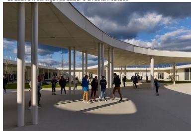
Le bâtiment est organisé autour d'un atrium central.