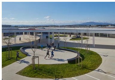
Le système en cour de cloître forme une protection contre les vents fréquents.

En pénétrant dans la cour, les quatre ailes s'offrent d'un seul regard, abritant à l'ouest, de chaque côté d'un couloir central ponctué d'un patio , les locaux administratifs et les locaux collectifs des élèves donnant sur la cour (CDI, foyer, sanitaires). Au nord, se trouve le pôle Segpa. Les deux autres ailes accueillent les salles d'art, de sciences et d'enseignement général au sud.