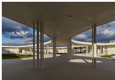
La couverture partielle de la cour crée des cadres vers le ciel.

Plus vaste que dans le programme du concours , elle couvre une surface de 2 770 m 2 .