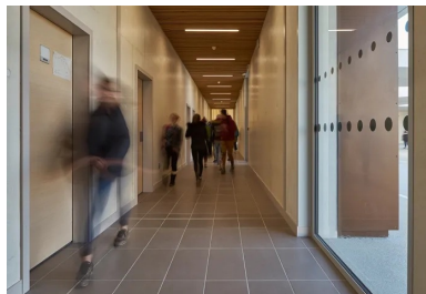
Les circulations sont vastes et éclairées le plus naturellement possible.

L'extraction se fait par des petites tourelles métalliques posées sur le toit au-dessus de chaque salle de classe. Celles-ci sont constituées d'un ventilateur, de supports et d'un grillage anti-volatile. Lorsque le ventilateur se met en route, il crée une dépression sous le capot et force la circulation de l'air.