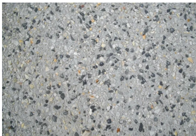
Le béton désactivé des cheminements intègre un mélange de granulats locaux Roche Blain (gris noir) et Barenton (gris blanc).

En 2011, la communauté d'agglomération de Caen-la-Mer en devient propriétaire pour un euro symbolique. Le site, encombré de munitions (plus de 1 400 engins explosifs de toutes sortes y ont été recensés), est dépollué et déminé. Objectif : transformer le quartier en zone d'activité économique et y créer des emplois (un millier à terme). « Nous allons utiliser la réserve de foncier pour répondre aux demandes des entreprises qui vont crescendo depuis ces deux dernières années », expliquait alors Joël Bruneau, président de Caen-la-Mer. L'ancien complexe comptait 57 bâtiments. Seuls vingt ont été conservés et proposés à des investisseurs privés (30 000 m 2 ), tandis que des constructions neuves ont été lancées. L'agence d'Eurovia sise à Blainville réalise les travaux de requalification complète. Reprise des 15 000 m 2 de voirie, 8 km d'assainissement des eaux usées et eaux pluviales et l'ensemble des réseaux sur 5 km (éclairage public, télécommunications, eaux potables, y compris la fibre optique), incluant l'aménagement de deux parkings (l'un de 250 places et l'autre de 650, soit 900 places au total, réalisés uniquement en enrobé) et d'une piste cyclable de 2 km en béton désactivé . En 2017, les implantations vont se multiplier (voir encadré). Et qui dit « implantations » dit « cheminements ».