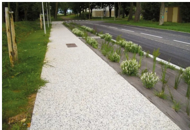
Le long de route, la voie de circulation douce (piste cyclable) de 2 km en béton désactivé.

Eurovia entame la réalisation des nouvelles constructions – aujourd'hui, en voie d'achèvement – au cours du premier trimestre 2017, avec du béton fourni par Cemex, à base de ciment Calcia . L'ancien casernement peut achever sa mue par une touche minérale, esthétiquement qualitative et qui présente une durabilité très appréciable.