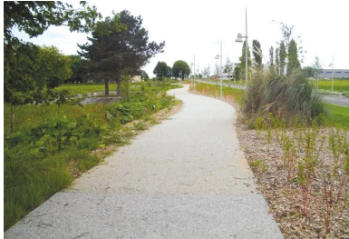
Produit dans l'unité Cemex de Giberville, le béton décoratif mis en œuvre sur les cheminements du nouveau quartier Kœnig est un béton C25/30 XF2 fibré (formule Nuantis Minéral de Cemex, ciment Calcia).

Huit ans plus tard, le quartier a commencé à reprendre vie. Une métamorphose élégamment soulignée par le béton décoratif .