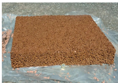
Peu après 12 heures, sur l'aire de repos de Bellevue, A7, sens Lyon-Marseille, au kilomètre 86. Les travaux sont achevés. Une planche d'échantillonnage a été réalisée. Elle servira à confirmer les performances du béton drainant.

« La spécificité d'Hydromedia®, précise-t-on chez Lafarge, c'est d'être un béton drainant de haute efficacité pour la gestion des eaux pluviales des voies piétonnes et des chaussées soumises à un trafic de véhicules légers ou de poids lourds occasionnels. Sa technologie innovante allie esthétique, perméabilité et résistance mécanique, tout en répondant aux enjeux de la construction durable . »