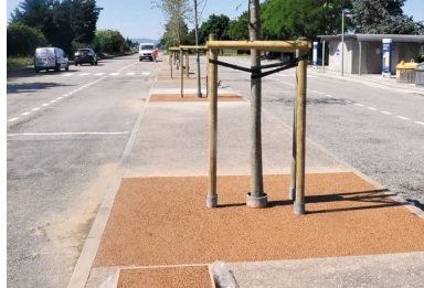
Peu après 12 heures, sur l'aire de repos de Bellevue, A7, sens Lyon-Marseille, au kilomètre 86. Les travaux sont achevés. Une planche d'échantillonnage a été réalisée. Elle servira à confirmer les performances du béton drainant.

Sa fréquentation est à la hauteur de sa notoriété. Si les deux métropoles qu'elle relie détiennent les records de trafic (120 000 véhicules par jour à Lyon ; 135 000 véhicules par jour à Marseille intra-muros), tous les tronçons sont très sollicités. Ainsi, 70 000 véhicules empruntent, chaque jour, le trajet entre Vienne et Orange, avec des pics à plus de 180 000 véhicules par jour lors des transhumances estivales !