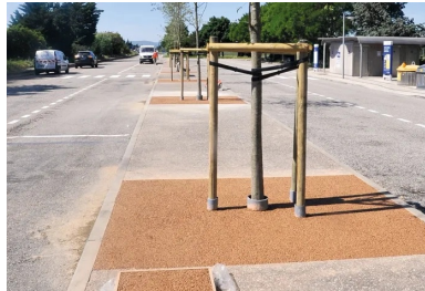
Peu après 12 heures, sur l'aire de repos de Bellevue, A7, sens Lyon-Marseille, au kilomètre 86. Les travaux sont achevés. Une planche d'échantillonnage a été réalisée. Elle servira à confirmer les performances du béton drainant.

Sa fréquentation est à la hauteur de sa notoriété. Si les deux métropoles qu'elle relie détiennent les records de trafic (120 000 véhicules par jour à Lyon ; 135 000 véhicules par jour à Marseille intra-muros), tous les tronçons sont très sollicités. Ainsi, 70 000 véhicules empruntent, chaque jour, le trajet entre Vienne et Orange, avec des pics à plus de 180 000 véhicules par jour lors des transhumances estivales !