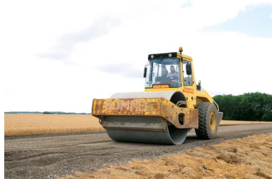
L'atelier de compactage composé d'un « vibrant » (un cylindre monorouleur V5) et d'un « pneu » (un PS 300).