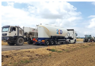
À l'occasion du bicentenaire de l'invention du ciment artificiel par Louis Vicat, les livraisons ont été effectuées par des porteurs spécialement dédiés.