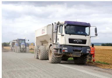
Épandage du liant hydraulique routier LHTS 54 de Vicat et vérification de la bonne répartition du liant au mètre carré (méthode dite « à la bêche »).