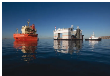
Fabriquée en Pologne, le caissonnier Marco Polo a été convoyé sur un navire submersible à travers la mer du Nord, la Manche, l'Atlantique, le détroit de Gibraltar et enfin la Méditerranée. Il est arrivé au Grand Port de Marseille après un périple de 14 jours.

Le volume impressionnant de béton nécessaire à la fabrication de chaque caisson (3 600 m 3 pour les treize plus gros, hors poteaux Jarlan ) est ainsi coulé par l'intermédiaire de trois mâts de bétonnage, capables de placer le béton en tout point du coffrage glissant . Ces mâts sont reliés en contrebas à autant de pompes à béton, elles-mêmes alimentées en permanence par deux à trois camions toupies par heure, en provenance des deux centrales à béton des industriels Lafarge et Cemex, la première étant située sur le port de Marseille, l'autre à proximité. Pour sécuriser l'approvisionnement et la production, des pompes de secours et une troisième centrale à béton sont disponibles à tout moment.