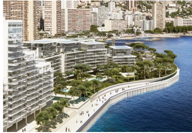
Les programmes de l'extension (logements de très grand luxe, commerces...) seront fondés sur un remblai de sable marin. La face supérieure de la ceinture de caissons accueillera une promenade piétonnière.

L'enveloppe extérieure des caissons constituée de quatre voiles de 70 cm d'épaisseur est contreventée par une grille de voiles intérieurs orthogonaux de 35 et 45 cm d'épaisseurs formant jusqu'à 24 cellules. « Ces contreventements sont destinés à reprendre les nombreuses sollicitations mécaniques que les caissons subiront une fois la ceinture en place, à savoir les efforts générés par la houle, les séismes et même les tsunamis ! », poursuit le directeur du chantier, précisant que les ouvrages ont été conçus en anticipant une élévation du niveau de la mer liée au réchauffement climatique. En partie haute de chaque caisson, dans la zone de marage, une chambre d'atténuation - dite chambre Jarlan - est ménagée pour briser les vagues et atténuer leur énergie. Une « grille » - constituée d'une quinzaine de poteaux de 7,5 m de haut et de sections carrées de 0,9 m - marque l'entrée de cette cavité de béton.