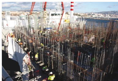
Le coulage de chaque caisson dans un coffrage glissant intégral est réalisé en continu 24 h/24 et 7 j/7. L'élévation moyenne est fixée à 12 cm/h.

Au fur et à mesure que le caisson prend de la hauteur, il s'alourdit, ce qui a pour effet de faire progressivement « couler » le caissonnier sur lequel il est posé. Si bien qu'une fois le sommet du caisson atteint, sa « moitié » basse est immergée (tirant d'eau moyen de 13 m). « Le ballastage du caissonnier permet alors de « décoller » le caisson et de le mettre en flottaison », décrit le directeur du chantier. Il est alors déplacé jusqu'à un deuxième atelier, situé à quelques dizaines de mètres de là, où sont réalisés les poteaux en béton armé constituant la « grille » d'entrée de la chambre Jarlan .