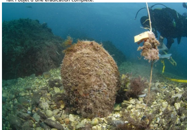
De nombreuses mesures écologiques ont été prises sur la future emprise de l'extension en amont du chantier. 143 grandes nacres, espèce protégée, ont par exemple été déplacées vers la réserve marine attenante du Larvotto.