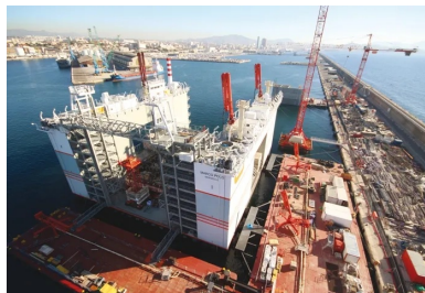
Les caissons sont fabriqués l'un après l'autre dans un caissonnier installé dans le bassin est du Grand Port de Marseille. Ce dock flottant unique en son genre s'enfonce dans l'eau au fur et à mesure que le caisson prend de la hauteur et s'alourdit.

Pour assurer la continuité de coulage tout en satisfaisant à l'ensemble des contraintes de durabilité auxquelles l'ouvrage est soumis, une formule unique d'un béton adapté a été mise au point.