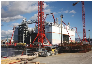
Le bétonnage continu des caissons est réalisé par l'intermédiaire de trois mâts de bétonnage, reliés sur le quai à trois pompes à béton, alimentées par des camions toupies béton.

Le tout en restant particulièrement attentif à la maîtrise des impacts écologiques du projet