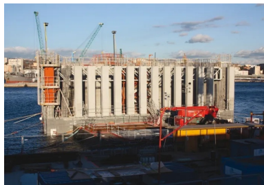
Afin d'éclaircir la teinte des poteaux Jarlan en béton qui resteront visibles en phase définitive, leur formulation intègre du dioxyde de titane.

d'assise, il est simplement jointoyé au caisson précédent, sans liaisonnement mécanique.