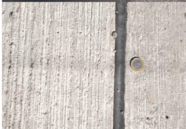
Les joints de retrait et le béton avec sa finition balayée.