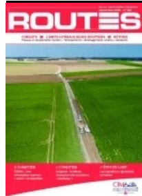
Cet article est extrait de Routes n°145

Maitrise d'ouvrage : Département de l'Ain - Maitrise d'œuvre : Département de l'Ain - Entreprises : Eurovia, Famy - Mise en œuvre du béton : Agilis - Fournisseur du béton : Béton Vicat (centrale de Péruges) - Fournisseur du ciment : Vicat (usine de Montaleu)